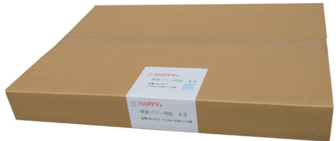
新包装形態 ボールケース・ラベル