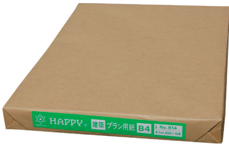
従来の包装形態 包装紙・ラベル